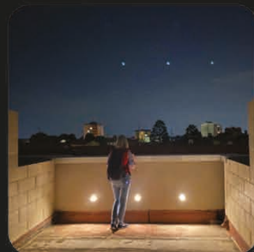
LA VISTA SUI TETTI DEL CENTRO STORICO DAL TERZO PIANO