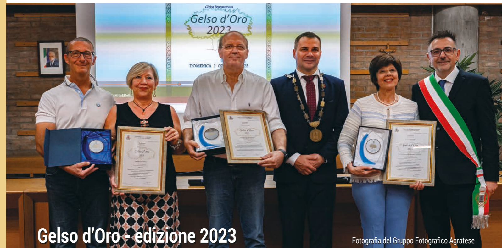
Gelso d'Oro - edizione 2023