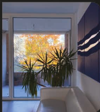
IL SOGGIORNO CON LA VETRATA SUL TERRAZZO E SUL PARCO A NORD