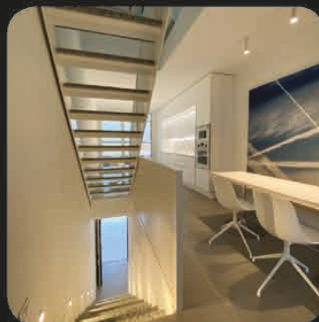
IL SOGGIORNO AL PRIMO PIANO LUNGO 11 METRI CON DUE TERRAZZI