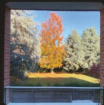
VISTA DAL TERRAZZO DEL FOGLIAME AUTUNNALE DEL PARCO