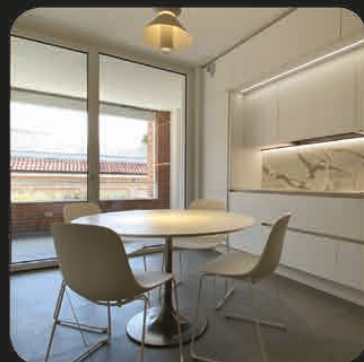
LA CUCINA CON LA VETRATA APERTA SUL TERRAZZO SUD