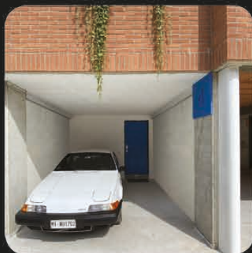
IL PORTICATO D'INGRESSO CON IL POSTO AUTO COPERTO

è visitabile LA VILLETTA CAMPIONE ARREDATA da ArchHouse