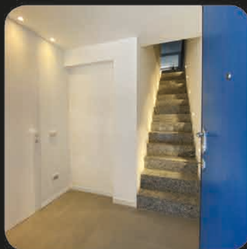
L'INGRESSO AL PIANO TERRA CON L'ACCESSO DAL BOX DOPPIO