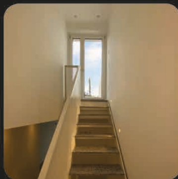
LA SCALA CON L'USCITA SUL SOLARIUM AL TERZO PIANO