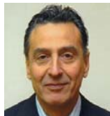
ASSESSORE PICASSO Luigi Deleghe: Commercio, Artigianato, Affari Generali e Legali, Polizia Municipale e Protezione Civile