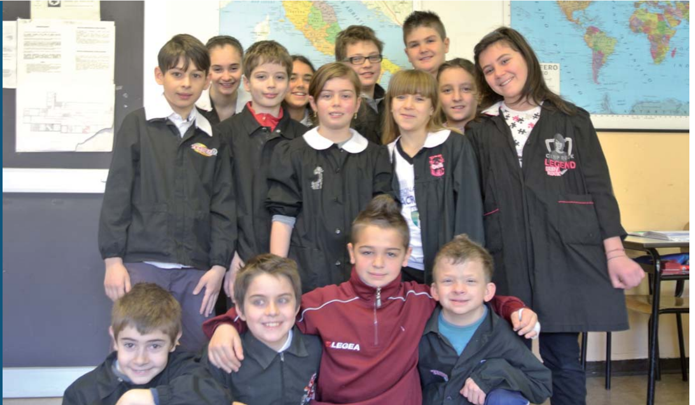
▼ Lavoro collettivo della classe a dimostrazione come non sia mai troppo presto per mettere semi di legalità nei cittadini di domani.