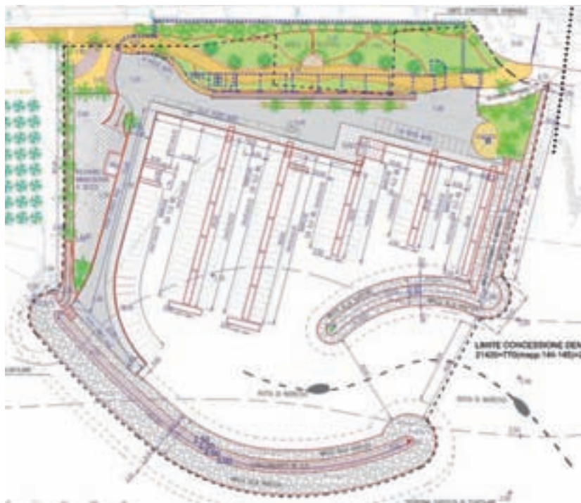
► Dettagli del progetto

L'iter burocratico del progetto del nuovo porticciolo è ripartito in Regione Liguria, con la conferenza dei servizi, che ha esaminato la variante che si è resa necessaria per adeguamenti tecnici, che aveva già ottenuto il via libera da parte della commissione edilizia e del consiglio comunale.