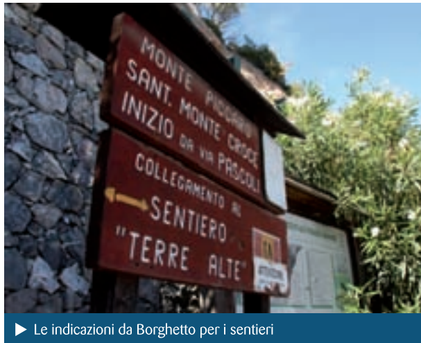
► Le indicazioni da Borghetto per i sentieri