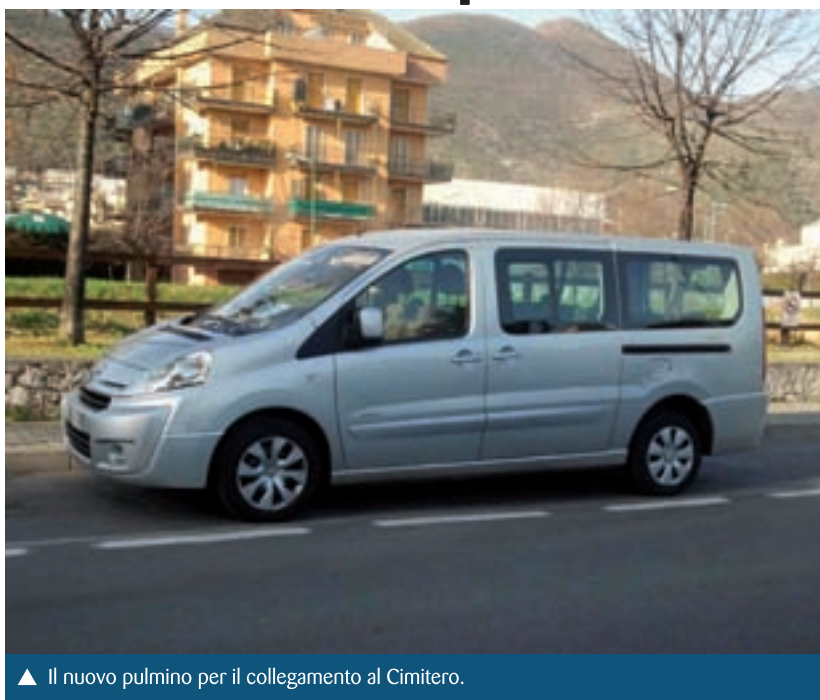
▲ Il nuovo pulmino per il collegamento al Cimitero.

È partito il nuovo servizio sperimentale di collegamento bus con destinazione cimitero di località Rive, grazie all'accordo tra il Comune e la ditta di autonoleggio FORMICA di Loano. Il nuovo servizio, che sostituisce quello già in essere da alcuni anni e svolto dalla S.A.R. prima e poi dalla T.P.L., viene ora effettuato da un'azienda privata che l'Amministrazione Comunale ha scelto in sostituzione dei precedenti gestori, onde agevolare i cittadini, ed in particolar modo gli anziani o coloro che sono privi di mezzi di trasporto propri, per effettuare la visita ai propri cari estinti tumulati nel nuovo cimitero al confine con il comune di Toirano. Il tragitto sarà uguale a quello precedente, ma sarà effettuato con un miniautobus da 8 posti, partendo sempre dal piazzale di Pineland, transitando per via Ponti per poi raggiungere il centro storico e proseguire sino al cimitero.