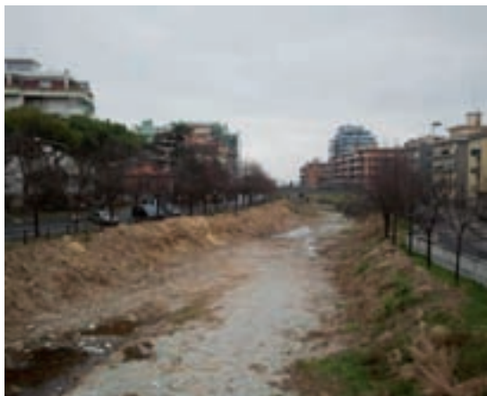
► Torrente Varatella - Zona Sud