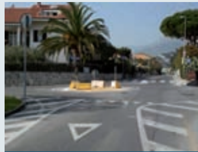
► Stato attuale via Pineland - via Maiella

Nelle due immagini progettuali provvisorie sono illustrati lo stato di fatto attuale e quello futuro con le caratteristiche fondamentali degli interventi destinati