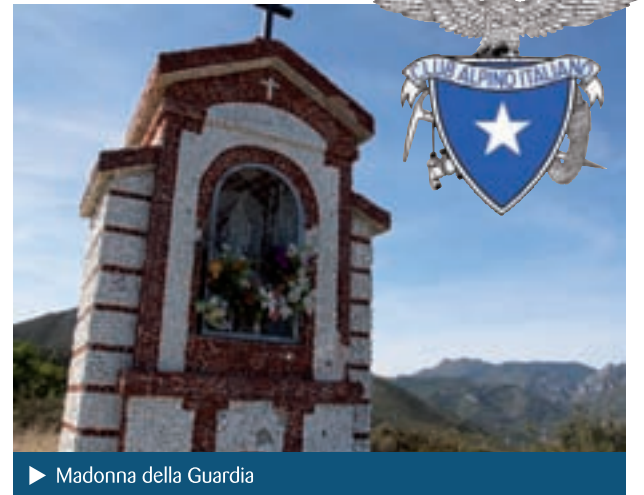
► Madonna della Guardia