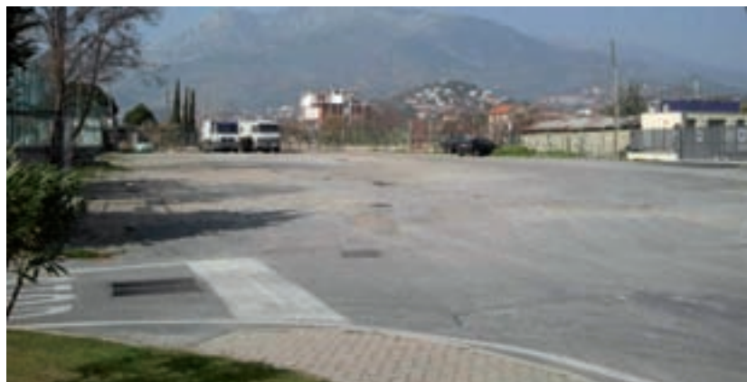
▲ Stato attuale dell'area