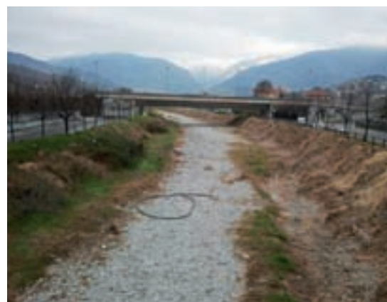
▲ Torrente Varatella - Zona Comune