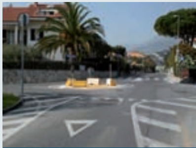
► Stato attuale via Pineland - via Parioli

Sono in fase di progettazione i lavori che riguarderanno la costruzione di due nuove mini rotonde lungo via che conduce a Pineland.