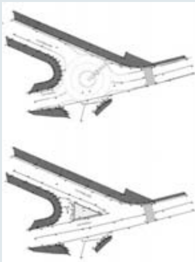
▲ Rotonda via Pineland - via Parioli

Anche se i tratti viari interessati non sono soggetti ad una alta densità di traffico veicolare, risultano particolarmente pericolosi per la conformazione