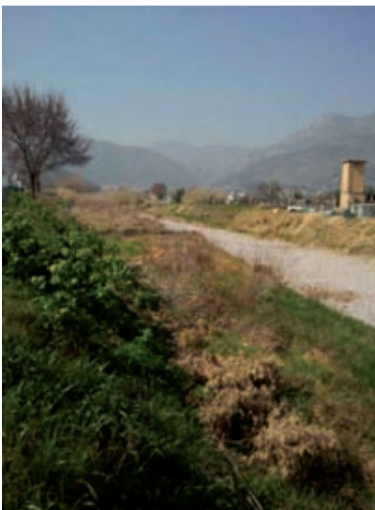
▲ Torrente Varatella - Zona a monte