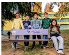
SCUOLA VIA LAMARMORA