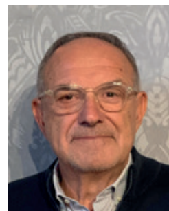
Walter Dell'Acqua Assessore alle politiche territoriali per la vivibilità e il decoro urbano