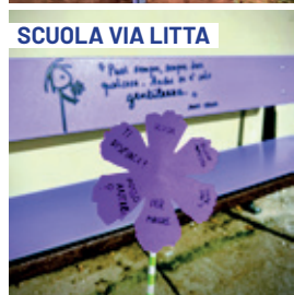
SCUOLA VIA LITTA