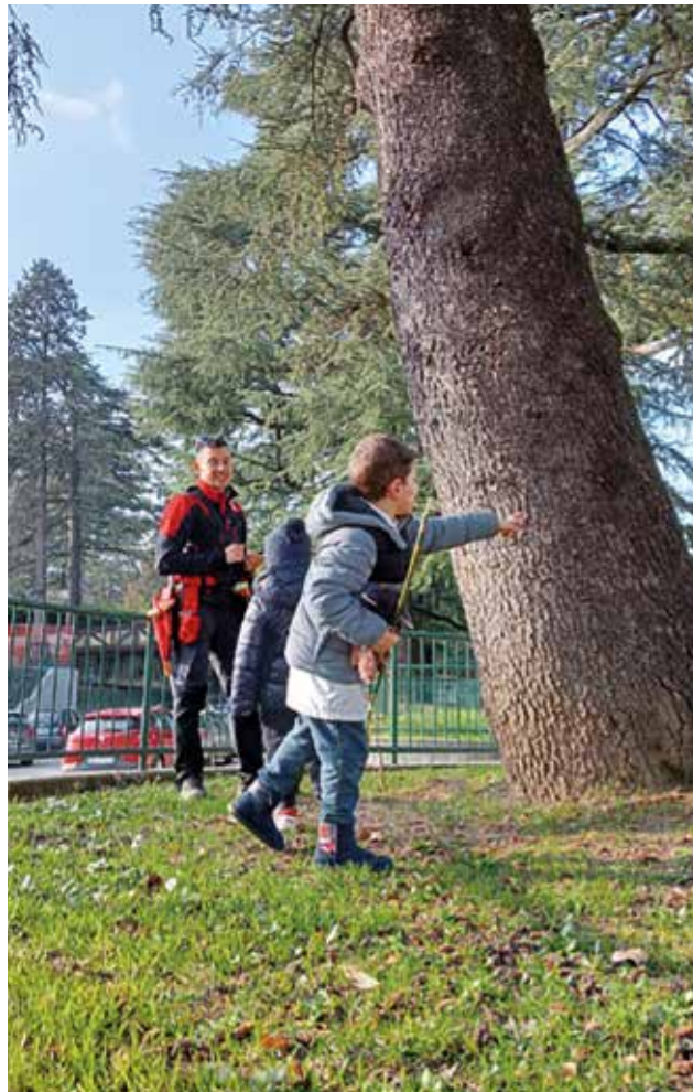
Foto significativa del rilievo – i bambini interpellano l'agronomo

Lo stato vegetativo della maggior parte delle alberature può essere considerato soddisfacente.